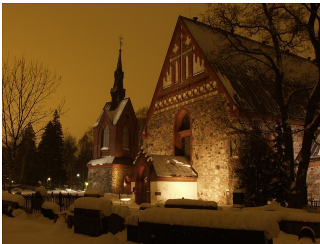
Kuva 2. Pyhän Laurin Kirkko Helsingin Pitäjässä Vantaalla

Turvallisuuteen ei ole Espoon kirkon hautausmaalla kiinnitetty huomiota sen enempää. Hautausmaalla ei ole omia kameroita, vaan ainoat ovat kirkon rakennusten yhteydessä. Tähän asti Espoon hautausmaat ovat säilyneet ilman ilkivaltaa. Työntekijöiden toiveita löytyy aina, joista yleisimpiä ovat uuden kaluston hankkiminen, sekä palkan korotukset.