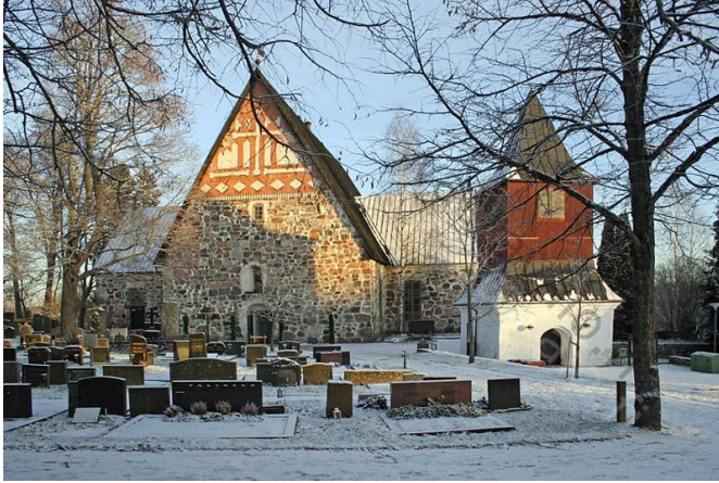
Kuva 1. Espoon Tuomiokirkko ja kirkon hautausmaa

Espoossa tapasimme Espoon hautausmaiden esimiehen, 30-40v. nainen. Työskentelee kyseisessä toimessa nyt viidettä vuotta.